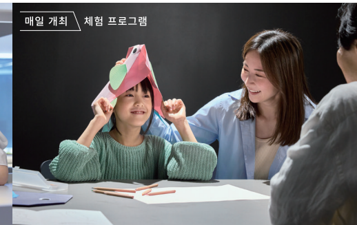
매일 개최 체험 프로그램