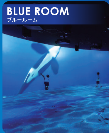
BLUE ROOM ブルールーム

両足で“ホップ”して移動するキタイワトビペンギンのダイナミックな行動を間近で観察できます。