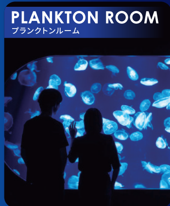
PLANKTON ROOM プランクトンルーム

"知床の海"をテーマにしたデジタルアート空間。実物大のシャチやマッコウクジラに出会えることもあります。