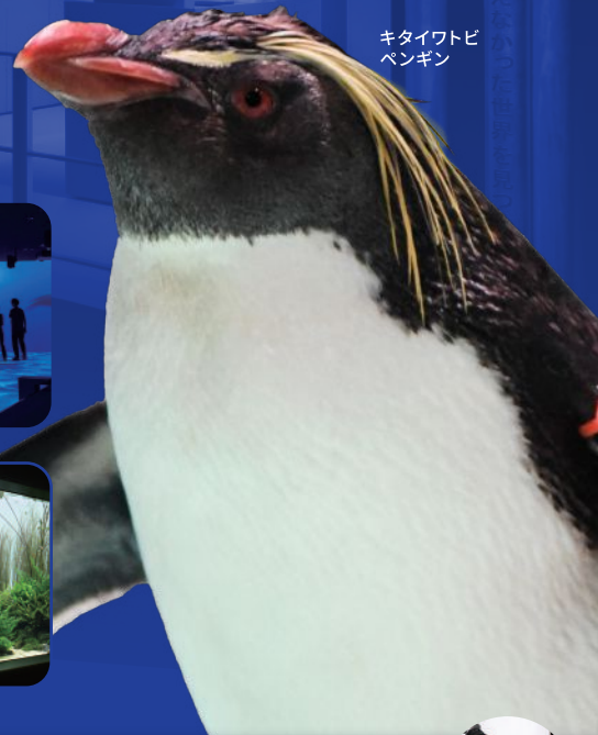
キタイワトビ ペンギン

AOAO SAPPOROは、まちなかにある自然の入口。 ペンギンなどの生物展示に加え、水族館のバックヤードの公開や 広大な海の世界にいるようなデジタルアートなど “人と水との関わり”に関する複合的な体験を提供します。