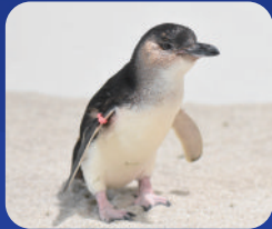
フェアリーペンギン