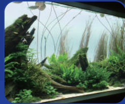
ネイチャーアクアリウム