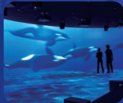
シャチ(デジタルアート)