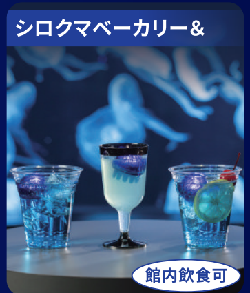
シロクマベーカリー & ファクトリー

大小16本の水槽の中を一定のリズムでゆらゆらと拍動するクラゲに、日常を忘れて癒されます。